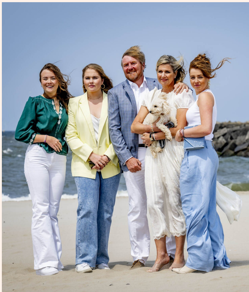
het Koninklijk gezin op het Zuiderstrand Scheveningen. V.l.n.r: Prinses Ariane, Prinses Amalia, Koning Willem-Alexander, Koningin Maxima, Prinses Alexia.